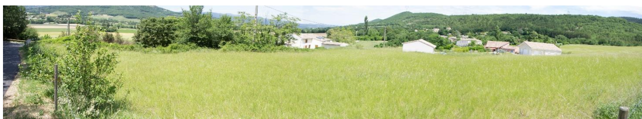
Localisation et vue de la zone AUc à Terre du Moulin (Eco-Stratégie, le 30/05/2017)