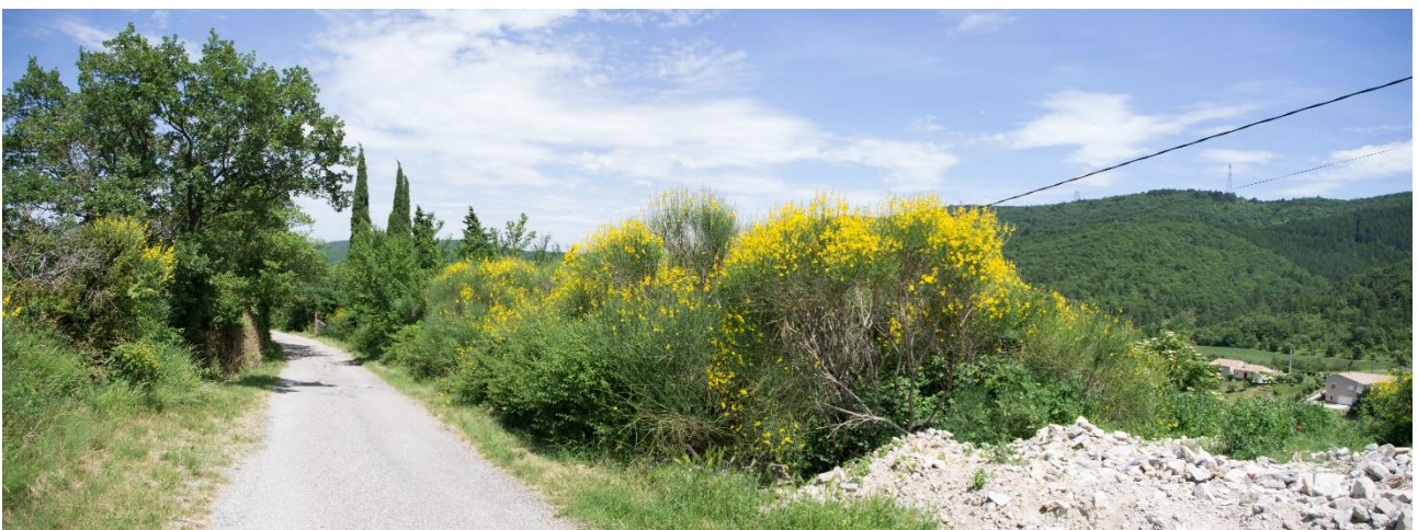
Localisation et vue de la zone AUs (Eco-Stratégie, le 30/05/2017)