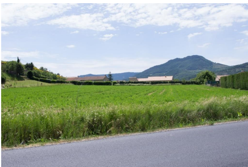
Localisation et vue de la zone AUc à Tracieu-sud (Eco-Stratégie, le 30/05/2017)