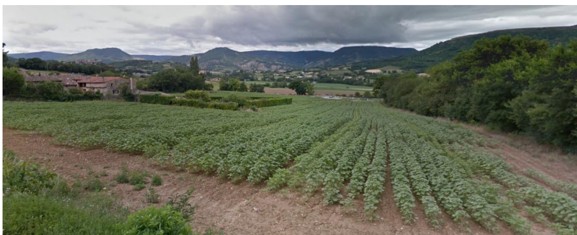
Localisation et vue de la zone AUc à La Serre