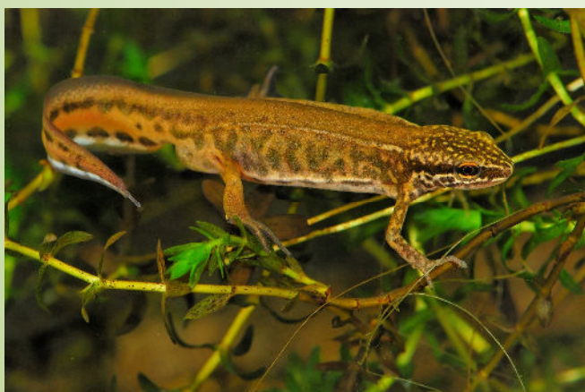
Triton palmé (B. Baudin)