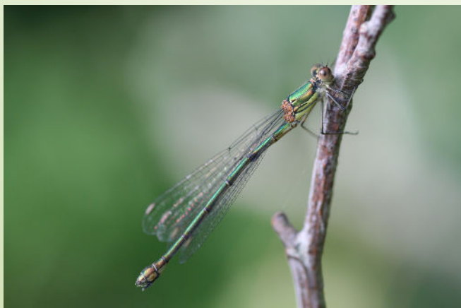
Leste vert (O. Duval)