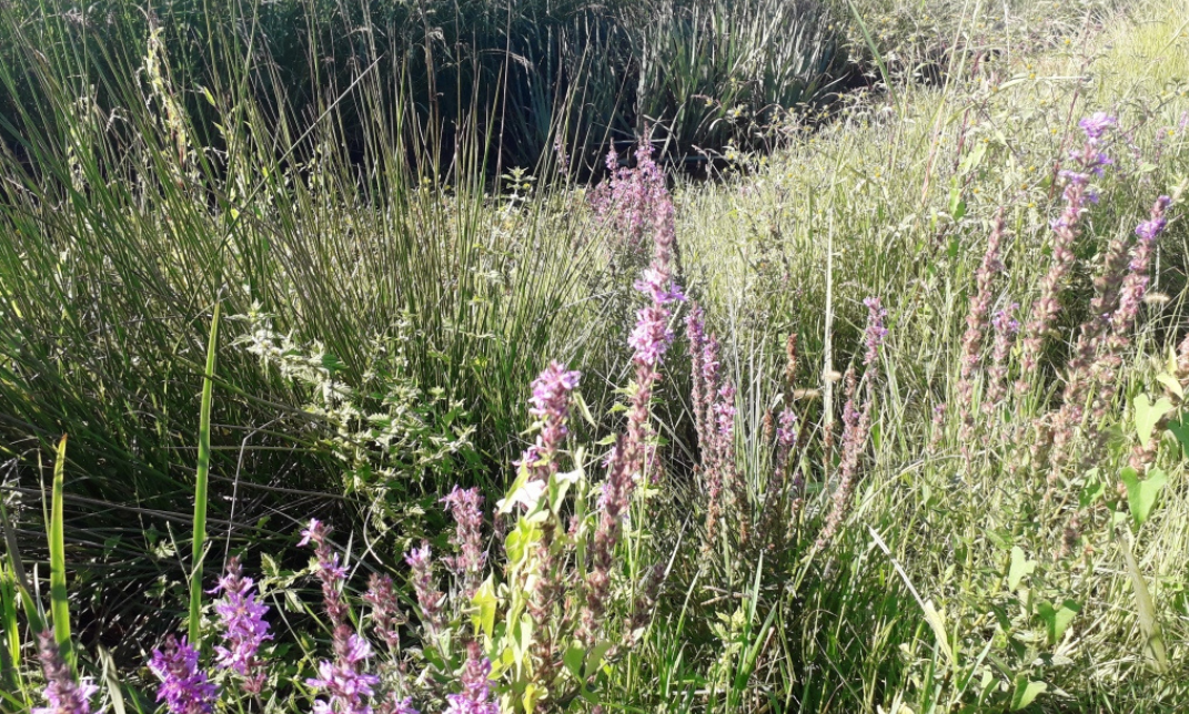
Un petit coin de fraîcheur dans la palus