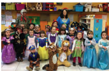
Le mardi Gras 2017 à Molineuf