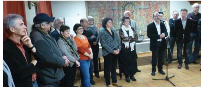
Les premiers voeux du Maire de VALENCISSE

En début d'année, Chambon a choisi de consulter sa population par sondage avant de s'engager dans la constitution d'une commune nouvelle avec Orchaise et Molineuf. Ce sont près de 58% des électeurs chambognots qui sont venus s'exprimer et répondre à la question « Êtes-vous favorable à la constitution d'une commune nouvelle avec Molineuf et Orchaise ? ».