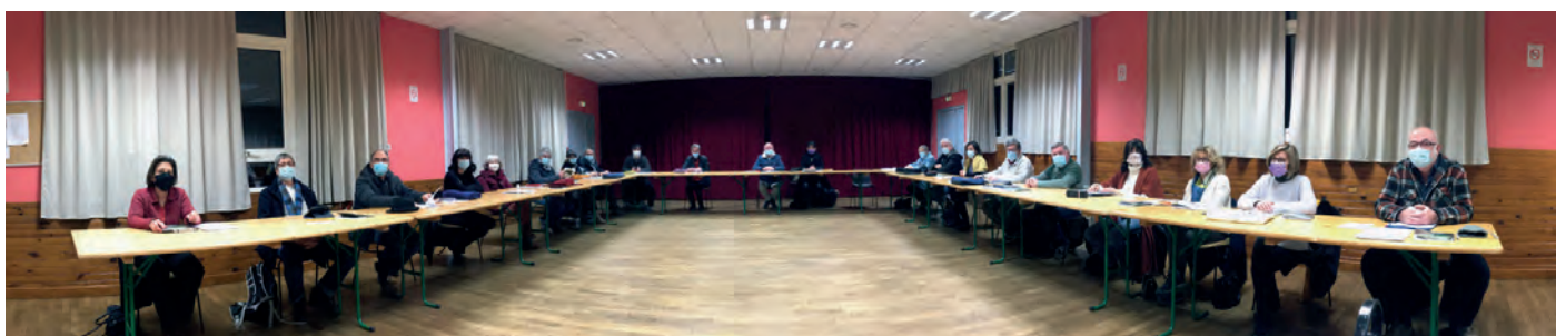
Le conseil au travail pendant la pandémie