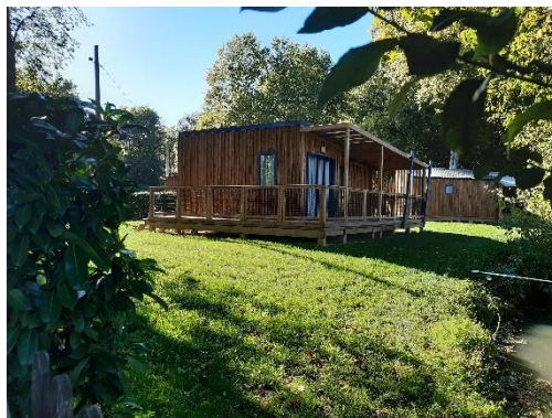
Chalet Badiane 35 m 2