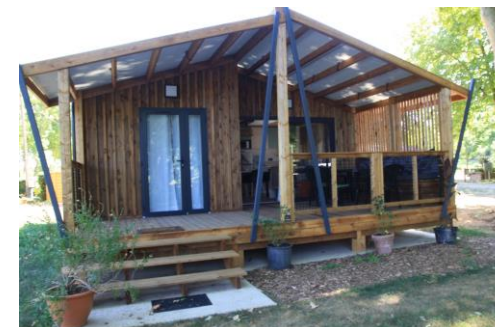
Chalet Mimosa 32m 2