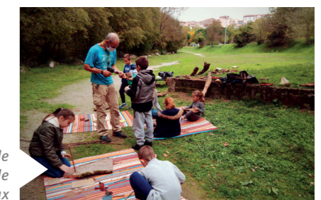
Atelier de construction de bateaux

LE PAYS D'ART ET D'HISTOIRE TRANSFRONTALIER ET LES FRANCAS S'INVITENT SUR LA COMMUNE DE MAUREILLAS