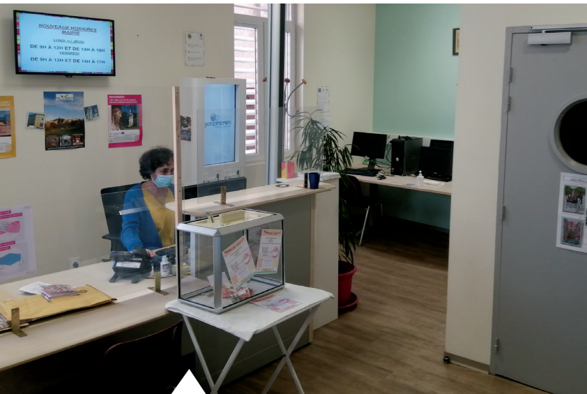
Accueil de la Maison pour Tous

Pour tous les Maureillanais ainsi que pour les touristes ou visiteurs