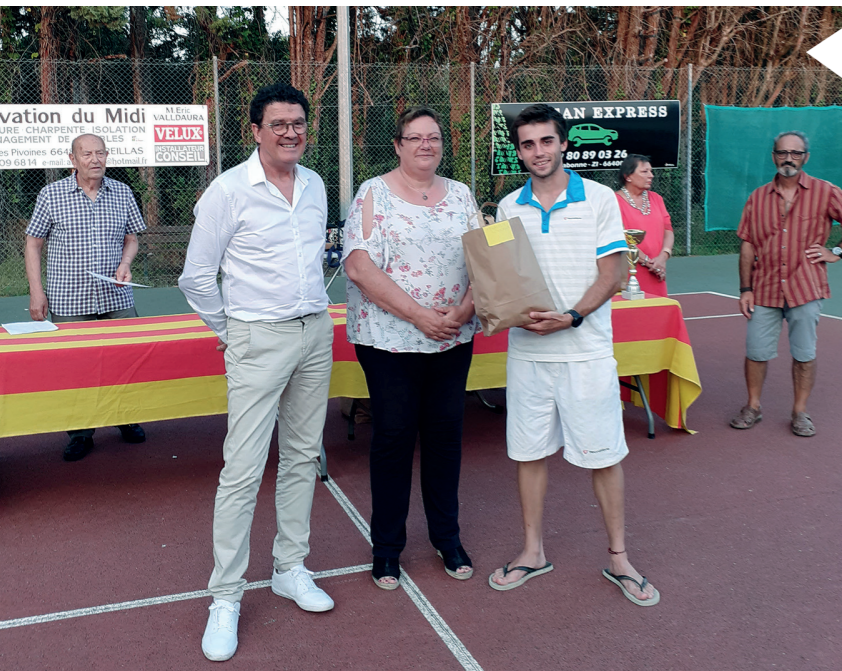
Remise des récompenses en présence du Maire

➤ Marc BRIERE - Av. Joan Cayrol ➤ www.club.fft.fr ➤ t.c.v.maureillas@free.fr ➤ 04 68 83 00 99