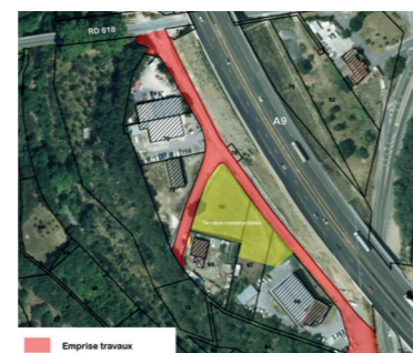
Vue aérienne :

La Communauté des communes a planifié des travaux d'aménagement dans les différentes zones d'activités, à ce titre la zone John Morgan de Maureillas-Las Illas va bénéficier d'importants travaux de requalification. Compte tenu que les travaux sur l'autoroute A9 sont maintenant terminés, les travaux vont pouvoir débuter prochainement. L'objectif de ces travaux est de favoriser l'implantation de nouvelles entreprises sur la commune en améliorant leurs conditions d'accueil.