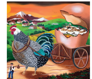
Peinture Christian Lloveras