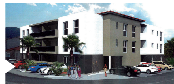
Les Feixes I

Un projet d'amélioration de la circulation et des voies d'accès est à l'étude et devrait être réalisé au cours du mandat, afin de répartir les flux de véhicules et sécuriser les déplacements doux vers le village.