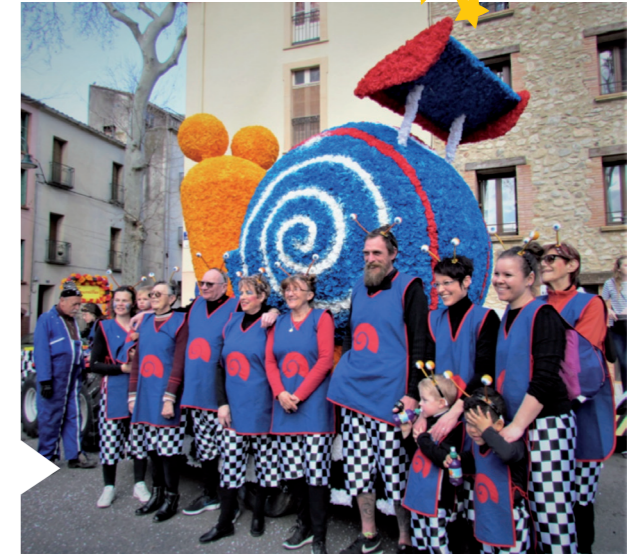
7 mars 2020 Carnaval de Cérêt

➤ Gilles FRANZI Président Maison pour Tous - Place de la République ☎ 07 81 90 46 25