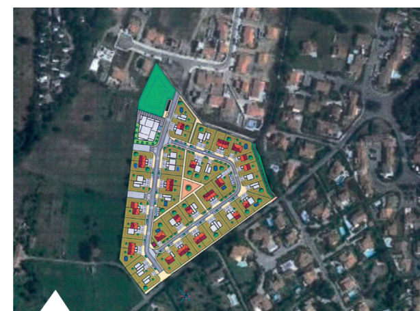
Les Feixes II

Le dispositif permettra de loger une quinzaine de familles.