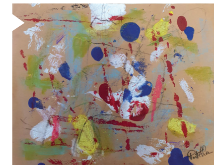
Peinture Claude Portella