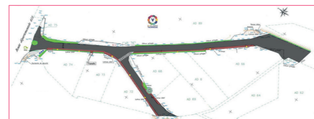
Esquisse Zone d'activités : Voie enrobée, trottoirs, espaces verts, éclairage, zone de stationnement (consultable sur www.vallespir.com )