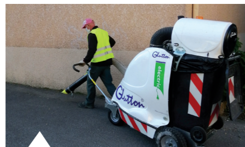
« Le glutton »

La propreté du village est une attente des Maureillanais. C'est pourquoi la première décision fut l'acquisition d'un aspirateur de rue dit « le glutton » augmentant ainsi les surfaces nettoyées tout en diminuant la pénibilité du manipulateur.