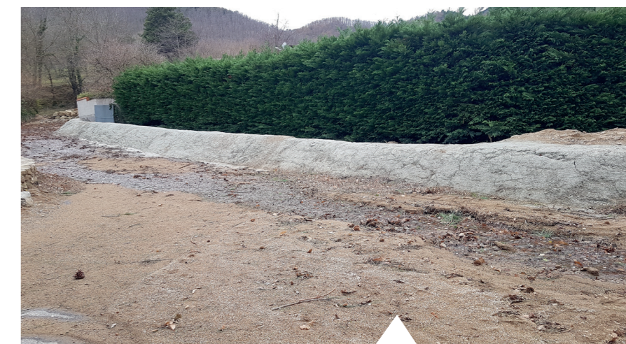
Merlon de protection

► Pour sécuriser le village des coulées de boue et des inondations, la commune et le département ont mis en place de façon provisoire un merlon (ou digue).