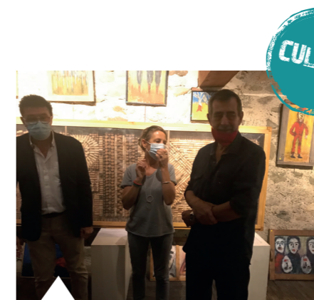
Exposition de peinture par Gérard BERTRAND