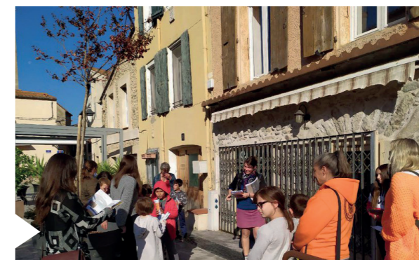
Visite du vieux village

Pendant les vacances scolaires de Toussaint, une visite en famille du vieux village a été organisée à travers la découverte de dates « mystères » inscrites sur les murs de pierre des maisons et des édifices : cela à partir d'un petit livret élaboré par « le Pays d'Art et d'Histoire » avec Julie, notre guide conférencière.