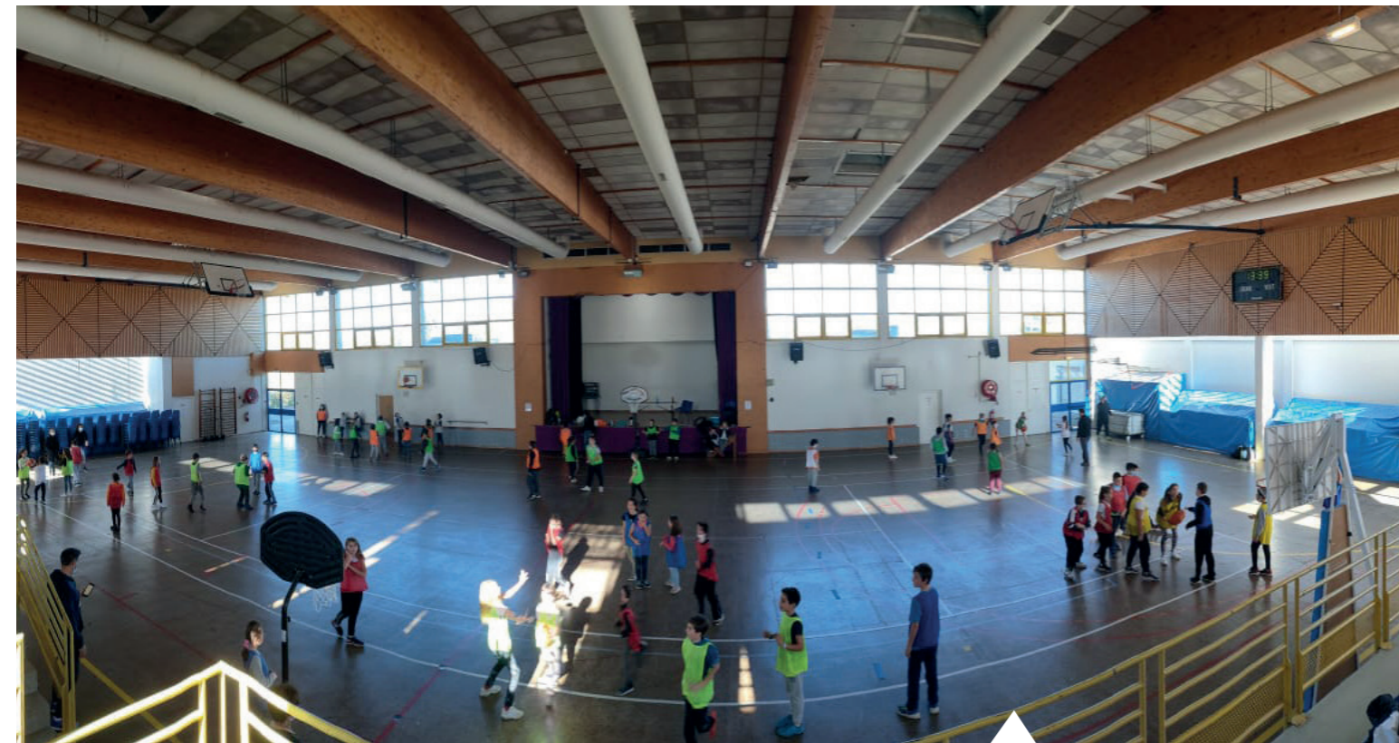
Rencontre sportive au gymnase des Echards