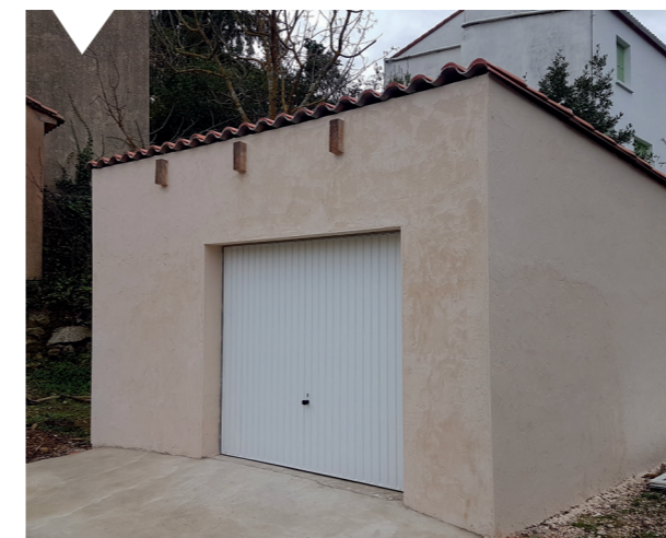
Bâtiment de stockage du matériel technique

L es services de la commune ont réalisé un bâtiment qui permettra de stocker tout le matériel.