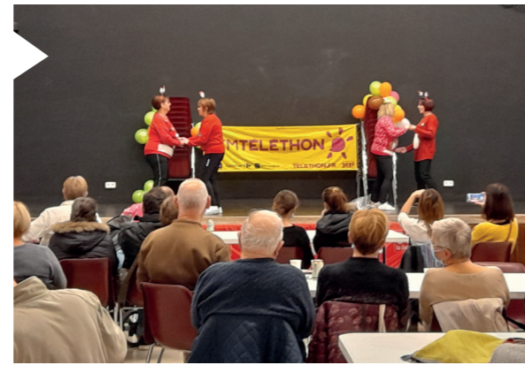
Salle comble et ambiance chaleureuse étaient au rendez-vous !

Le petit déjeuner oriental de Mimi est également revenu pour notre plus grand plaisir à 9h30 samedi 6 novembre sur le marché place de la République et les ventes d'objets divers par Maureillas Sans Frontière ont permis de récolter la sommes de 12 300 € qui a été entièrement reversée à l'AFM Téléthon.