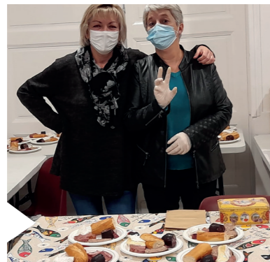
Buvette et repas chaud