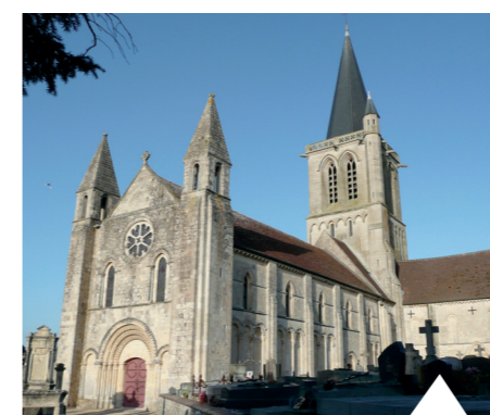
Eglise de Bretteville l'Orgueilleuse