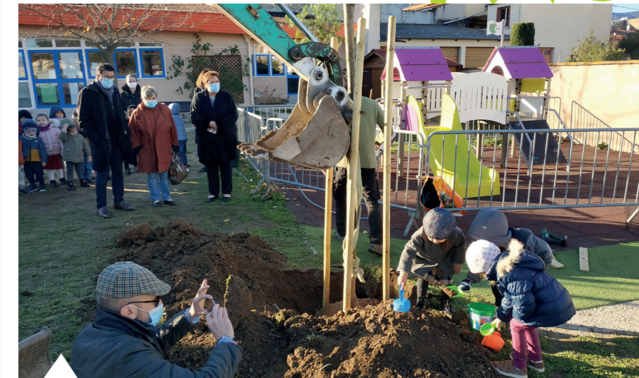
Plantation de l'arbre