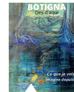
Exposition de Sandrine BOTIGNA SALLÉ

Du 02/12 au 28/12/2021 Exposition de peinture « BOTIGNA des d'aqui » par Sandrine BOTIGNA SALLÉ