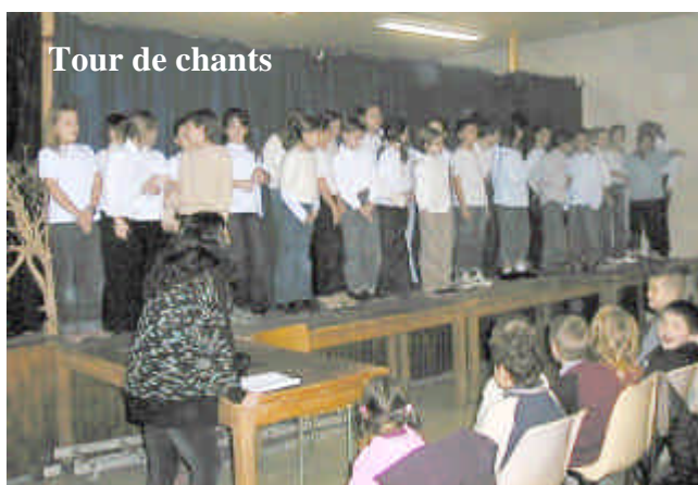
Tour de chants

La première de ces activités a été un spectacle de théâtre, le 10 Décembre 2004, proposé gracieusement par un parent d'élève, précédé d'un tour de chant des enfants de l'école.