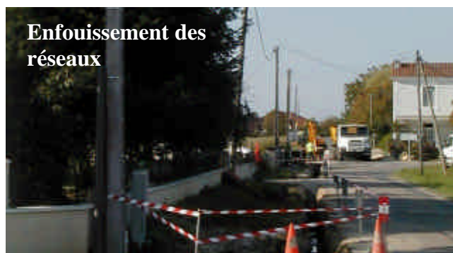
Enfouissement des réseaux

Ainsi, il ne restera bientôt plus de poteaux depuis le croisement de la route du Chantier avec celle de La Champagne. En même temps, l'éclairage public a été étendu jusqu'à l'entrée de Limeyrat.