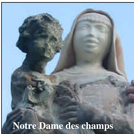
Notre Dame des champs

Notre Dame des champs , située sur le chemin longeant la voie ferrée aux Seiglières, avait depuis longtemps perdu sa tête.