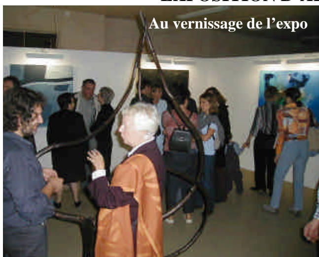
Au vernissage de l'expo

L'Art Contemporain avait rendez-vous à Limeyrat au mois d'octobre .