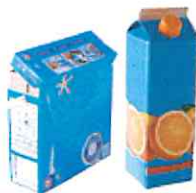
Briques alimentaires, cartons