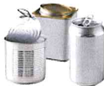
Boîtes de conserve, canettes