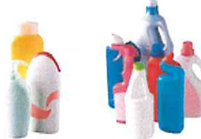
Petits flacons de produits de toilette et d'entretien