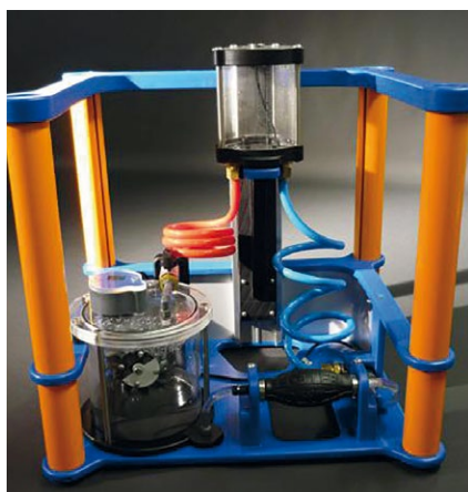
Exposition Gratuite - Ouverte à tous sur les heures d'ouverture de la MJC.

DU MARDI 16 AU VENDREDI 19 NOVEMBRE 2021 📍 MJC