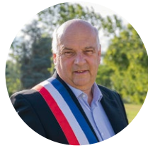
— Alain PRIGENT Maire