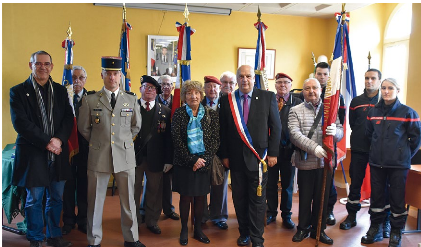
Rassemblement à la mairie à 11h puis dépôt de la gerbe et remise des médailles au Monument aux Morts. Un vin d'honneur est organisé à la mairie à midi.