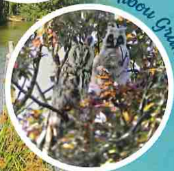
Hibou Grand Oye