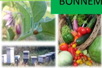
Respect de la Biodiversité