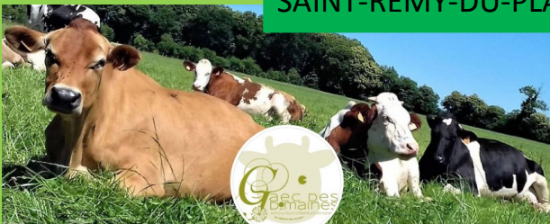
Gaec Des Domaines, Fromage et produits laitiers Producteur et transformateur laitier fermier