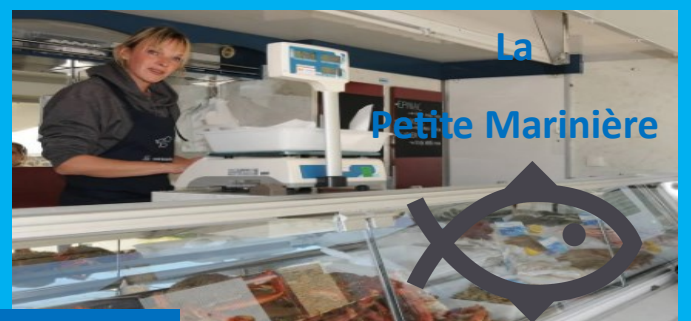
La Petite Marinière